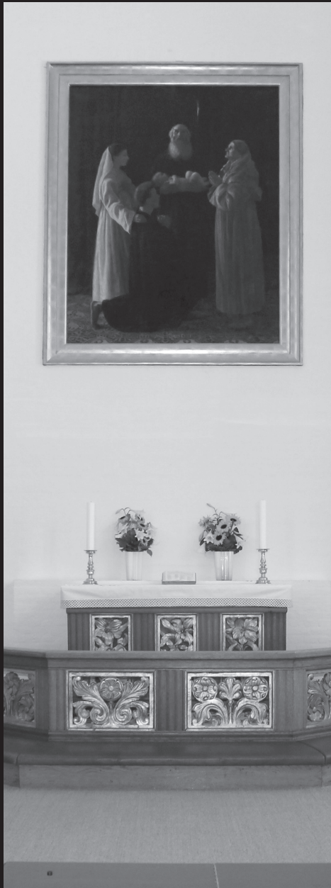
Alteret i Frihavnskirken